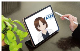
みんなの次世代窓口 「そうだん AI-Te- 相談相手 -」