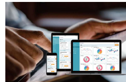
業務改善システム「CayzenAI」