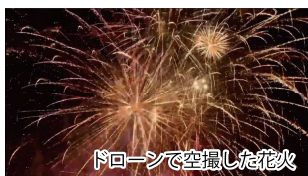
ドローンで空撮した花火

11月に開催された「えびな市民まつり 2024」(神奈川県海老名市主催)において、花火の空撮、市民向けドローン体験会の運営を行いました。