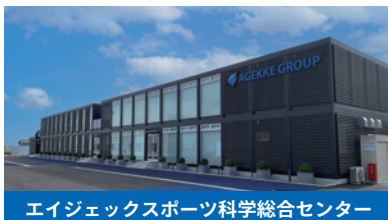
エイジェックスポーツ科学総合センター

取り組みの第一弾として、エイジェックスポーツ科学総合センターに新東工業製のフォースプレートを導入し、すそ野の広いデータ測定、製品開発・拡販を行うと共に、測定データを基にしたコーチング・教育資格プログラムの確立を目指します。